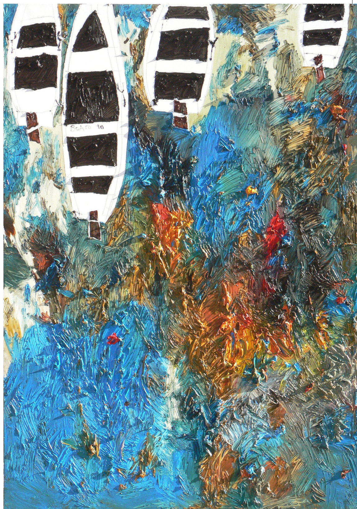
Matteo Boato, Mare II, 2010, olio su tela, 100x140